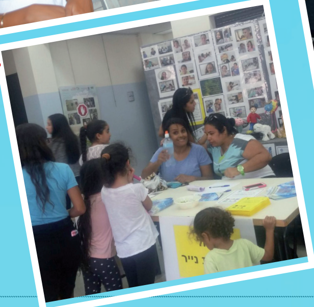
יריד החוגים התפרש על פני כל המתנ"ס ושימש כתובת נוחה לרישום לשפע של פעילויות וחוגים!