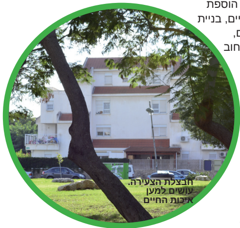
חבצלת הצעירה, עושים למען איכות החיים

ליצירת קשר: סמדר, טל': 050-6697579 @smadars59 walla.com.il