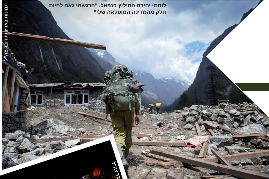
לוחמי יחידת החילוץ בנפאל. "הרגשתי גאה להיות חלק מהמדינה המופלאה שלי"

"אני שמח להיות חלק משליחות שאין גדולה ממנה. כל הפרופורציות בחיים משתנות ואתה פתאום מבין, אילו אנשים יש לנו במדינה, איזו הקרבה, ומסירות ונתינה. עם כל המתח והלחץ, אין דברים כאלה. ידעתי את זה תמיד אבל דווקא כשהייתי בארץ זרה – הרגשתי כמה אני מרגיש קרוב למדינה המופלאה שלי".