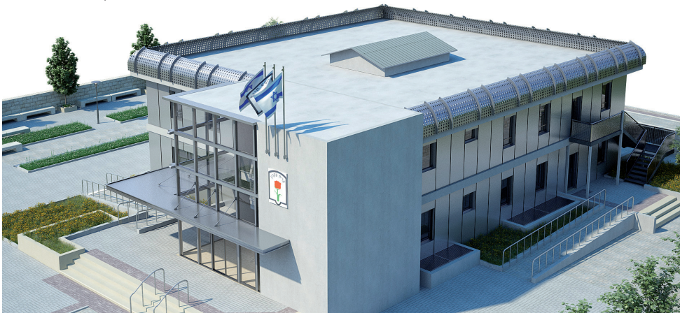
דגם של בניין המועצה העתידי

שנים ורוצים לראות את עתידם ועתיד ילדיהם כאן. אני מתפעל מהרציונות שהפגינו התושבים ומהיצירתיות. כל אלה יסייעו לנו להגיע לשביל הזהב וליצור כאן תכנית ליישוב תוסס, תרבותי ומוביל".