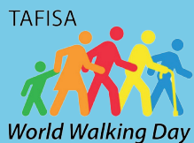
World Walking Day

יום ההליכה הבינלאומי צוין בקרית עקרון במסלול הליכה מעגלי מלא באטרקציות