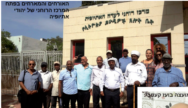
האורחים והמארחים בפתח המרכז הרוחני של יהודי אתיופיה

בדיון שהתקיים במועצה, ביקש יו"ר הוועדה, ח"כ אברהם נגוסה מראש המועצה וממנהלי המחלקות, להכין בקשות לסיוע תקציבי ואלה יוגשו על ידו למשרדי הממשלה