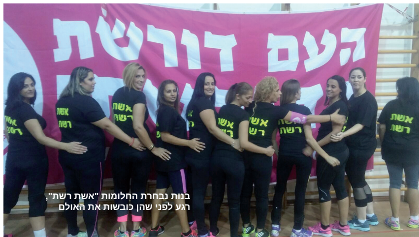
בנות נבחרת החלומות "אשת רשת", רגע לפני שהן כובשות את האולם

לפרטים נוספים והצטרפות לאחת הקבוצות, ניתן להתקשר למתנ"ס.