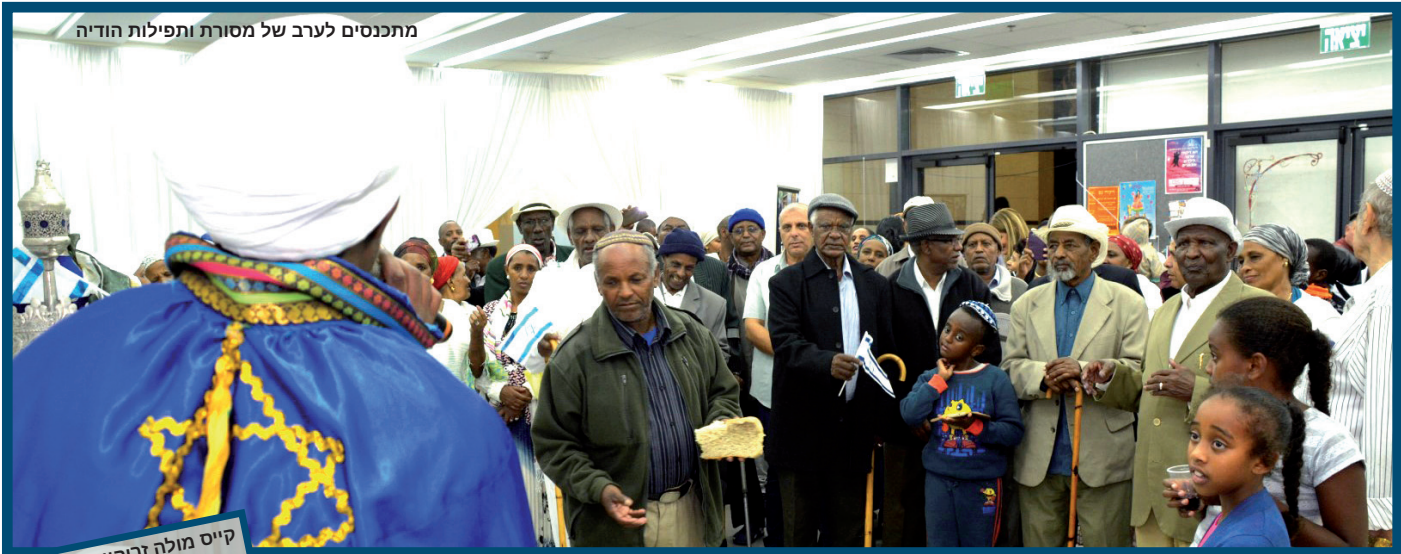
מתכנסים לערב של מסורת ותפילות הודיה