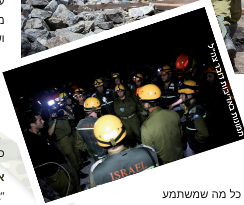
לוחמי יחידת החילוץ בנפאל

כל מה ששמתמע מזה, כגודי ח"ר לכל דבר. בעתות חרום, הייעוד הוא הצלת חיים ומענה לאירועי חילוץ והצלה בארץ ובעולם".