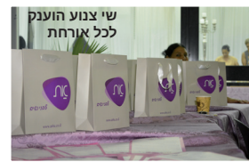
שי צנוע הוענק לכל אורחת