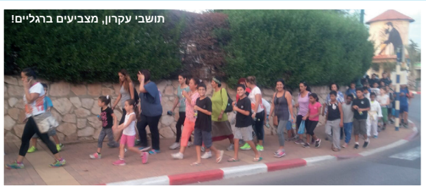
תושבי עקרון, מצביעים ברגליים!

בסוף חודש אוקטובר התקיים יום ההליכה הבינלאומי, שמטרתו להעלות על סדר היום הציבורי את החשיבות לקיום אורח חיים בריא. כחצי מיליון ישראלים הלכו ביום הזה לאורכה ולרוחבה של המדינה, ביניהם בתי ספר, אגודות ספורט וארגוני נשים, קשישים ואחרים, שגם הקדישו ליום זה, הרצאות וסדנאות בריאות. גם בקרית עקרון הוחלט ליטול חלק ביום ההליכה, כחלק מאג'נדה של ישוב המכבד אורח חיים בריא. בשעות אחר הצהריים,