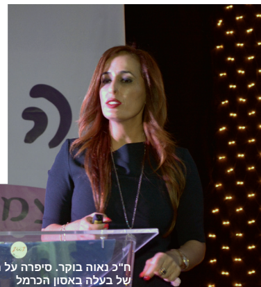
ח"כ נאוה בוקר. סיפרה על ההתמודדות עם מות של בעלה באסון הכרמל

מהאבל, לחיות עם כאב ואפילו לשמוח. אני בחרתי בחיים וכל אחת מהנשים הנמצאות כאן הערב, יכולה אף להחליט אף היא, שהיא בוחרת בחיים". לאחר הרצאתה של בוקר, עלתה על הבמה מרגלית צנעני שהתקבלה בתשואות חמות, הודיעה שהיא לא מכוונת לערב שקט ותרבותי